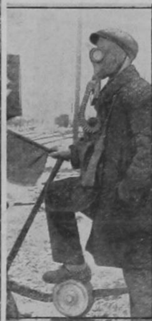
Ya está listo para la llegada de Somoza a Costa Rica...