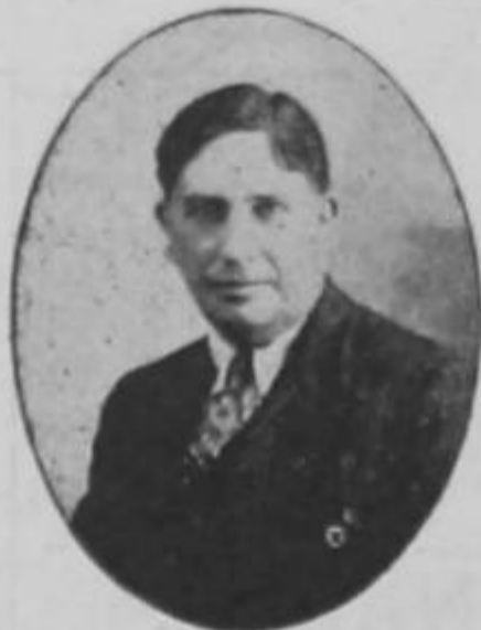
El colega del General Zomoza, del General Monge, del Padre Cayito y del Cura Borge, a quien hay que seguirle la corriente y no contradecirlo.