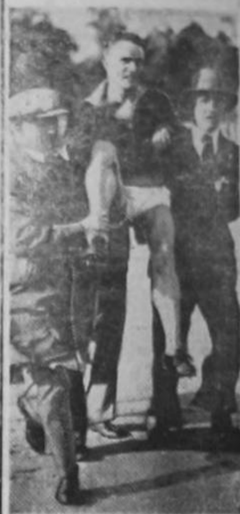
Después de oírlo declarar que don León Cortés era un buen presidente, respetuoso de las normas democráticas, un grupo de «brochas» saca en hombros a un diputado calderonista. (Los pantalones se le perdieron en el tumulto).