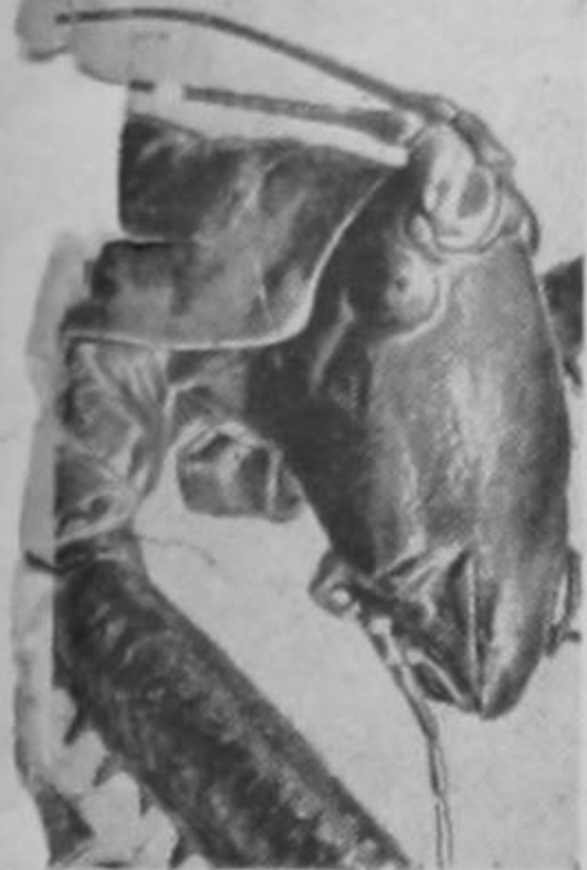
A Costa Rica va a caer la langosta, viene de Nicaragua.