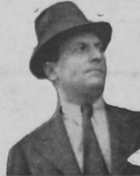
Nuestro ilustre Caudillo haciendo serio