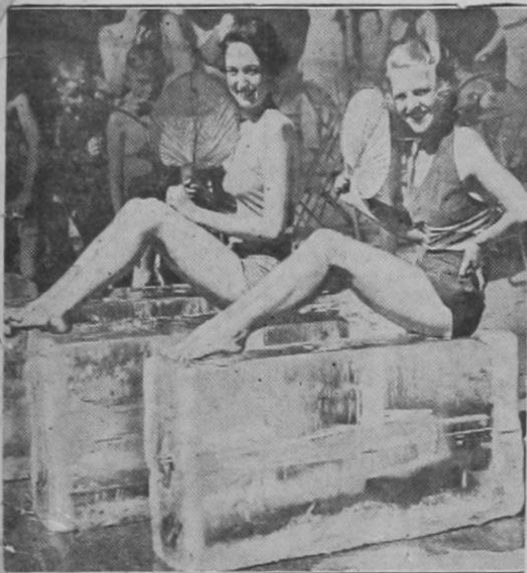
Estos témpanos de hielo están más contentos que unas acuas y más frescos que lechugas... Aquí en secreto, les admitimos que se están derritiendo de puro gusto... y encantados. (Recomendamos este procedimiento a los empleados del gobierno que hayan sufrido la poda del rabo).