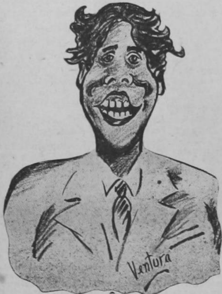
TIPITIN, TIPITIN, TIPITON FILIPICHIN, FILIPICHIN FILIPICHON... ESTE ES EL RÉTRATO DE UN GRAN BROCHON...